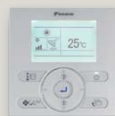
En option (BRC073)*

*La carte additionnelle KRP980A1 est nécessaire